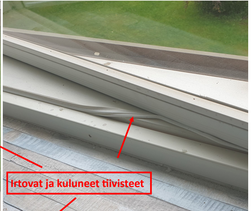
Irtovat ja kuluneet tiivisteet