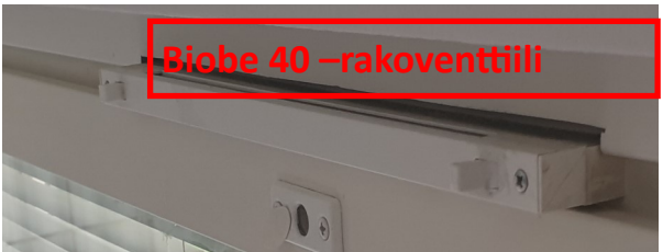
Biobe 40 -rakoventtiili